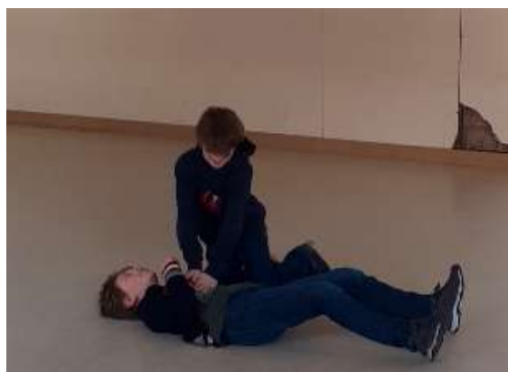
création de saynètes sur la thématique du respect du Droit Humanitaire International et de la dignité humaine en situation de guerre. Bruxelles, 2023.